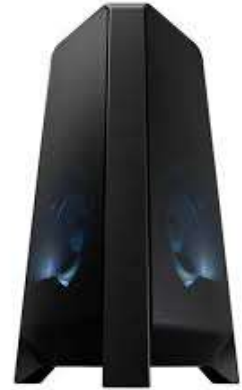
Equipo Mini SAMSUNG MX-T50

Contado: $ 450.000 Cuota Inicial: $ 70.000 12 Semanas: $ 40.000