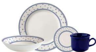
Vajilla Corona Dominó 4 puestos 16 piezas