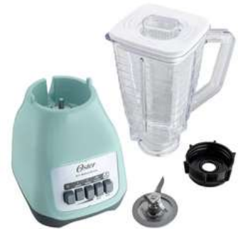
Licuadora Menta Oster Kaliman

Contado: $ 180.000 Cuota Inicial: $ 75.000 6 Semanas: $ 25.000