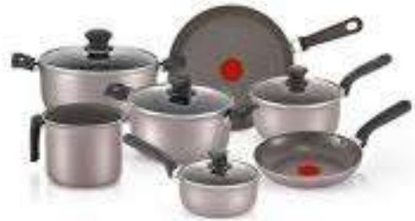
Bateria de Cocina 11 piezas

Contado: $ 229.900 Cuota Inicial: $ 60.000 7 Semanas: $ 33.000