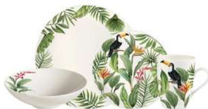
Vajilla Corona Habitat 4/16Pz