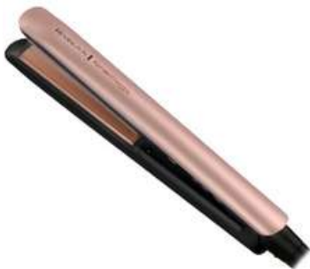
Plancha de Cabello REMINGTON S8599 Keratina Morado

Contado: $ 180.000 Cuota Inicial: $ 70.000 5 Semanas: $ 25.000