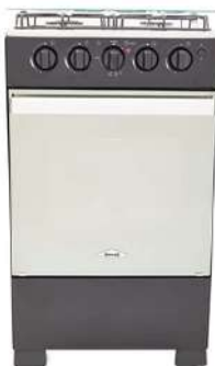
Estufa de Piso HACEB 4 Puestos Gas Natural Romero Reflex 50-Vidrio Negro

Cuota Inicial: $ 70.000 8 Semanas: $ 37.000