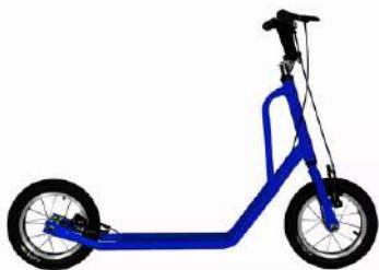
PATINETA RIN 16 NACIONAL ACERO ARO ALUMINIO