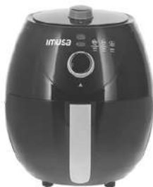
Freidora Aire IMUSA Esencial 3.2Lt Negra