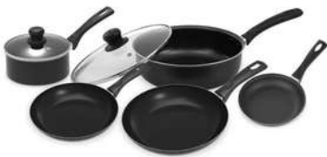
Bateria 7Pz Smart - Tradition

Contado: $ 350.000 Cuota Inicial: $ 80.000 10 Semanas: $ 35.000