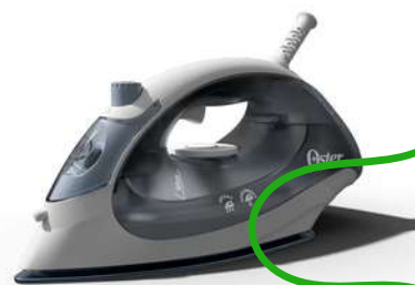
Plancha de Ropa OSTER vapor variable y antiadherente 2140005 Gris

Contado: $ 106.000 Cuota Inicial: $ 28.000 4 Semanas: $ 25.000