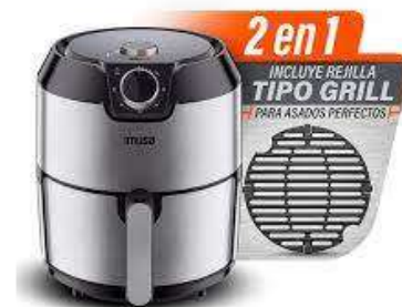
FreidAire IMUSA EasyF 4.2Lt"PI

Contado: $ 320.000 Cuota Inicial: $ 100.000 9 Semanas: $ 35.000