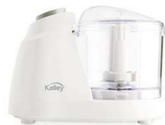
Proces A KALLEY MPA1004B "BI