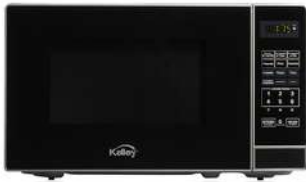
HORNO MICROONDAS K-MW07N (1)

Contado: $ 148.000 Cuota Inicial: $ 60.000 4 Semanas: $ 28.000