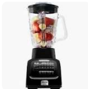
Lic IMUSA InfinyForce10V "Ng