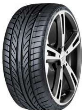
West Lake 215/60/17