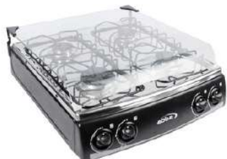
ESTUFA MESA GN TP V NEGRA SG4006N N QL