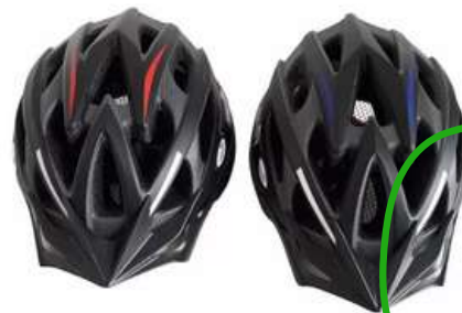
CASCO FORTE ADULTO MASTER