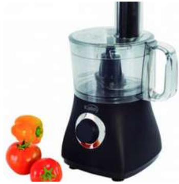
Procesador Alimentos Kalley K-MPA500N

Contado: $ 229.900 Cuota Inicial: $ 60.000 7 Semanas: $ 33.000