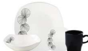
Vajilla Bambu cuadrada 4 Puestos/16 Piezas

Contado: $ 74.000 Cuota Inicial: $ 20.000 3 Semanas: $ 23.000