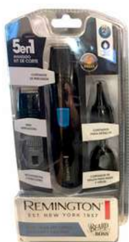
Kit Recortador REMINGTON PG181 5en1 Negro