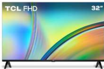
TTV TCL 32\" 32S5400AF FHD LED Smart TV Android Contado: $ 1.650.000 Cuota Inicial: $ 380.000 20 Semanas: $ 78.000