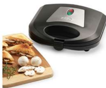
Sanduchera KALLEY K-SM300N Negro

Contado: $ 85.000 Cuota Inicial: $ 20.000 3 Semanas: $ 27.000