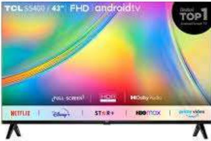
TV TCL 43\" S5400A FHD Contado: $ 1.150.000 Cuota Inicial: $ 300.000 20 Semanas: $ 55.000