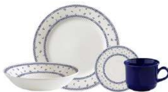
Vajilla CORONA Domino 4 Puestos/16 Piezas

Contado: $ 74.000 Cuota Inicial: $ 20.000 3 Semanas: $ 23.000