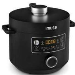
Olla Multifuncional IMUSA 5Litros 7211004471 Multichef PRO Negro