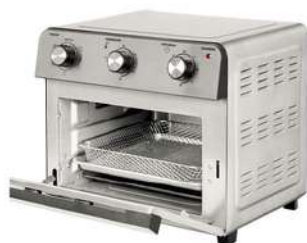
H Tost KALLEY Frei HA 20Lt"PI

Contado: $ 280.000 Cuota Inicial: $ 90.000 7 Semanas: $ 33.000