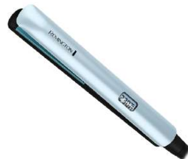
Plancha de Cabello REMINGTON S8500 Azul