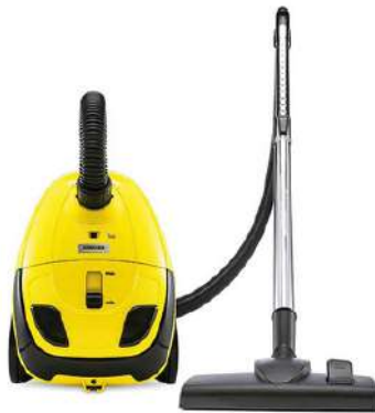
Aspiradora Karcher VC1 Amarillo y Negro

Cuota Inicial: $ 110.000 10 Semanas: $ 38.000