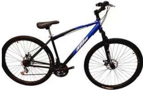
BICICLETA ATILA RIN 29 FRENO DISCO

Cuota Inicial: $ 110.000 12 Semanas: $ 40.000