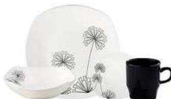
Vajilla Corona Otoño 4 Puestos 16 Piezas