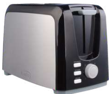
Tost KALLEY MTP750"Ng