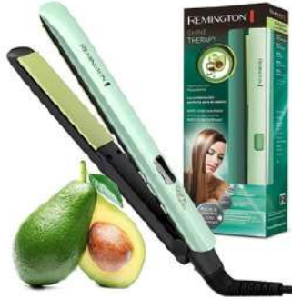
SPlancha de cabello AGUACATE

Contado: $ 108.000 Cuota Inicial: $ 28.000 4 Semanas: $ 25.000