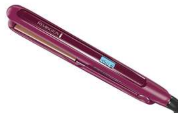
Plancha de Cabello REMINGTON S7740 Rosado