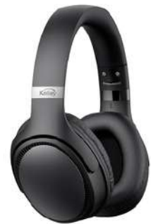
Aud Kall Bluet OnEar K-ANI Ng Contado: $ 90.000 Cuota Inicial: $ 23.000 3 Semanas: $ 30.000