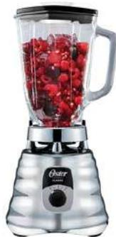
Licuadora OSTER Clásica BLST4655 700W Plateado

Contado: $ 317.000 Cuota Inicial: $ 100.000 9 Semanas: $ 35.000