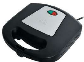
Sand Panini Kalley K-SMP200N