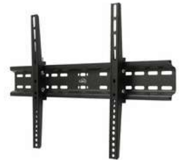
Base Kall Fija 37" a 70" Ng

Contado: $ 1.150.000 Cuota Inicial: $ 300.000 20 Semanas: $ 55.000