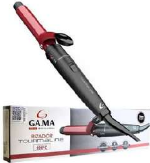
gsc_113184361_563641_1 Rizador GAMA

Contado: $ 108.000 Cuota Inicial: $ 28.000 4 Semanas: $ 25.000