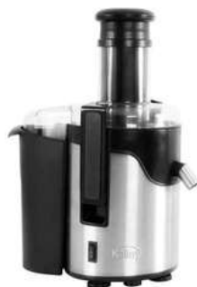
Ext Jug KALLEY JE750"Gr