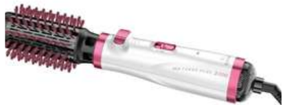
Cepillo de Cabello GAMA New Plus Blanco