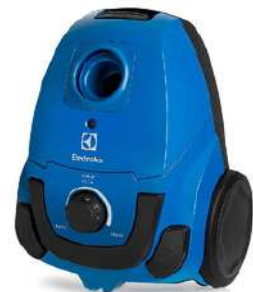
Hidrolavad 1600PSI 1700W Elite

Cuota Inicial: $ 110.000 16 Semanas: $ 38.000