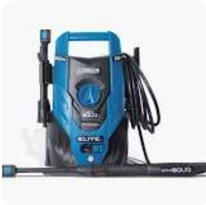
Hidrolavad 1600PSI 1700W Elite

Cuota Inicial: $ 80.000 16 Semanas: $ 33.000