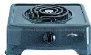
Est M HCB 1P Elect ARELEC-1"G

Cuota Inicial: $ 70.000 5 Semanas: $ 25.000