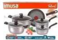
Juego De Ollas Imusa 9 Pzs Tapa Vidrio Talent Antiadherente

Contado: $ 150.000 Cuota Inicial: $ 60.000 4 Semanas: $ 28.000