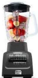
Lic IMUSA InfinyForce10V "Gr