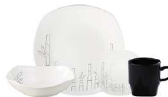
Vajilla Corona Bambú 4 Puestos 16 Piezas