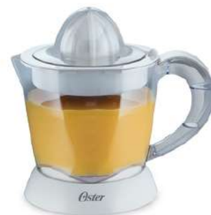
Exprimidor OSTER FPSTJU407W Blanco