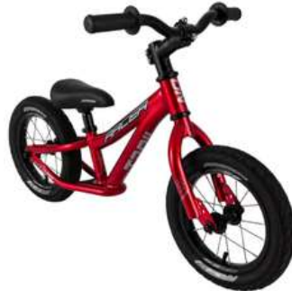
BICICLETA RIN 12 IMPULSO

Cuota Inicial: $ 120.000 16 Semanas: $ 35.000