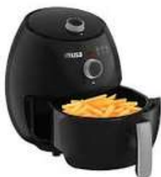
FreidAire IMUSA 3.2Lt Esenc"Gr

Contado: $ 280.000 Cuota Inicial: $ 90.000 7 Semanas: $ 33.000