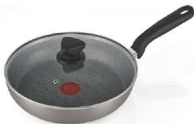
Sartén Alto IMUSA Antiadherente con Tapa de Vidrio 30 cm Talent

Contado: $ 120.000 Cuota Inicial: $ 30.000 5 Semanas: $ 22.000