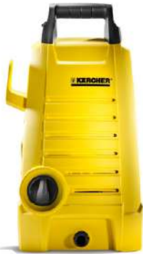
Hidrolavadora KARCHER K1