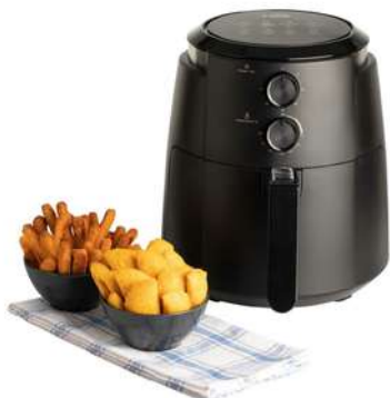
Freidora de Aire KALLEY 3.5Litros K-MAF35 Negro

Contado: $ 259.000 Cuota Inicial: $ 90.000 3 Semanas: $ 31.000