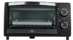
Horno Tostador KY K-MHE8009NO1

Contado: $ 310.000 Cuota Inicial: $ 70.000 8 Semanas: $ 37.000