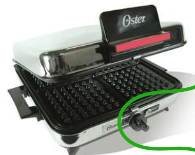
Plancha Sandwichera 3 en 1

Contado: $ 88.000 Cuota Inicial: $ 20.000 3 Semanas: $ 30.000