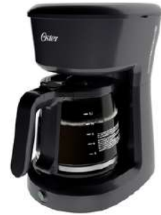
Cafetera OSTER 12tazas 2118216 switch Negro

Contado: $ 169.000 Cuota Inicial: $ 40.000 4 Semanas: $ 35.000