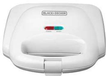
Sanduchera BLACK + DECKER SM1000W Blanco

Contado: $ 130.000 Cuota Inicial: $ 35.000 4 Semanas: $ 26.000