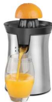
Exprimidor BLACK+DECKER CJ4000S Plateado