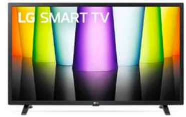
TV LG 32\" 32LQ63OBPSA HD Contado: $ 1.000.000 Cuota Inicial: $ 280.000 18 Semanas: $ 55.000