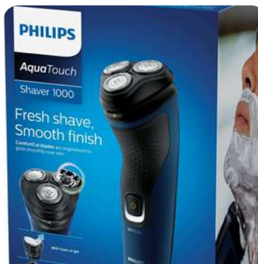
SAfeit PHILIPS S1121"Ng