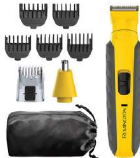
Kit de corte indestructible pg6855 Remington

Contado: $ 240.000 Cuota Inicial: $ 90.000 7 Semanas: $ 30.000