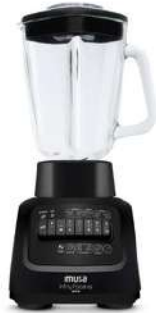
Licuadora IMUSA Infiny Force XL Negra 10 Vel

Contado: $ 172.000 Cuota Inicial: $ 70.000 5 Semanas: $ 27.000