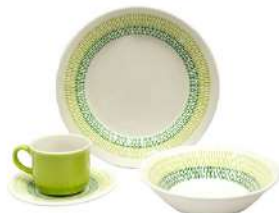
Vajilla CORONA Jaspe Verde 4 Puestos/16 Piezas

Contado: $ 74.000 Cuota Inicial: $ 20.000 3 Semanas: $ 23.000