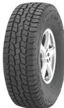
LTR 235/60R16 SL369 TL