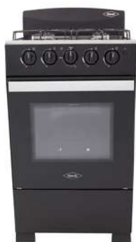
EstPiso HCB 52Cm4PGN ROM-T"NDN

Cuota Inicial: $ 150.000 12 Semanas: $ 45.000