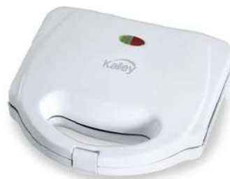
Sanduchera Kalley K-SM101