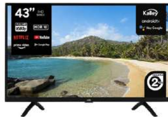
TV KALLEY 43 Pulgadas 109 cm ATV43FHDE FHD LED Smart TV Android

Contado: $ 1.650.000 Cuota Inicial: $ 380.000 20 Semanas: $ 78.000