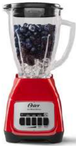
Licuadora Botones 2 Vel Vidrio Rj, BLSTKAGRPBO13

Contado: $ 172.000 Cuota Inicial: $ 70.000 5 Semanas: $ 27.000