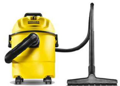
Aspiradora KALLEY K-VC21N MagicDuo 2 en 1 Negro

Cuota Inicial: $ 110.000 10 Semanas: $ 38.000