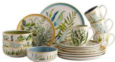
Vajilla 4-16 Siena