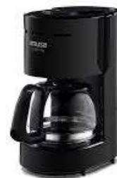
VCafet IMUSA CafeCity 6tz "Ng

Contado: $ 460.000 Cuota Inicial: $ 70.000 12 Semanas: $ 40.000