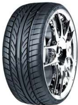
West Lake 225/40/17