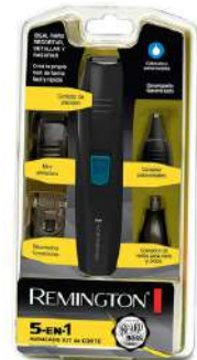
Detallador 5 en 1 remington pg181

Contado: $ 210.000 Cuota Inicial: $ 50.000 5 Semanas: $ 35.000