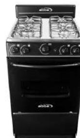
Estufa de Piso ABBA 4 Puestos Gas Natural AT101-5 Negro

Cuota Inicial: $ 260.000 18 Semanas: $ 46.000