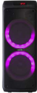
Parlante KALLEY K-BSK6OW Negro

Contado: $ 365.000 Cuota Inicial: $ 100.000 10 Semanas: $ 35.000