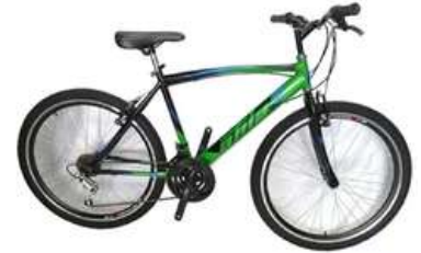
BICICLETA RIN 26 ACERO V- BRAKE ATILA

Cuota Inicial: $ 80.000 5 Semanas: $ 70.000