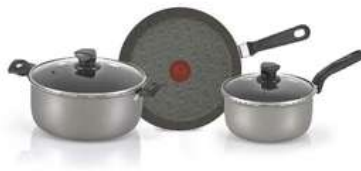
Bateria de Cocina 5 Piezas IMUSA Antiadherente Tapa de Vidrio Talent

Contado: $ 160.000 Cuota Inicial: $ 60.000 5 Semanas: $ 28.000