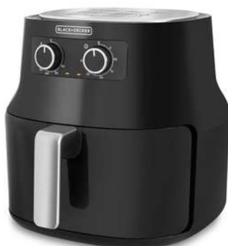
FreidAire B+D 4.5Lt HF4004"NBL

Contado: $ 160.000 Cuota Inicial: $ 60.000 5 Semanas: $ 28.000