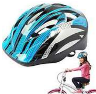
CASCO FORTE NIÑA