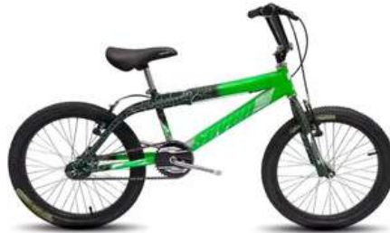
BICICLETA RIN 20 EN ACERO ARO SENCILLO NACIONAL

Cuota Inicial: $ 90.000 7 Semanas: $ 35.000