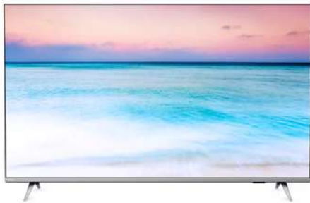
TV PHILIPS 50" 50PUT6654 4kUHD Plano Smart TV Android

Contado: $ 800.000 Cuota Inicial: $ 190.000 16 Semanas: $ 45.000