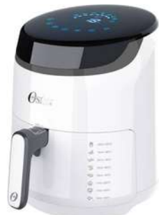
Freidora Oster Digital 3,2L

Contado: $ 259.000 Cuota Inicial: $ 90.000 3 Semanas: $ 31.000