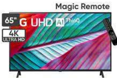
TV LG 65\" 65UR875OPSA 4KUHD Contado: $ 3.150.000 Cuota Inicial: $ 700.000 24 Semanas: $ 120.000