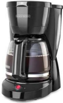
Cafetera BLACK+DECKER 12tazas CMO941B Negro

Contado: $ 169.000 Cuota Inicial: $ 40.000 4 Semanas: $ 35.000