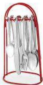
Set de cubiertos x 24 Arbolito