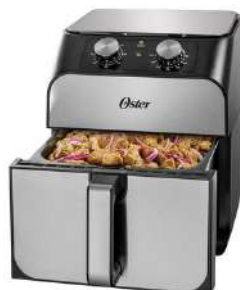
Freidora de Aire OSTER 6,8 Litros Plateado