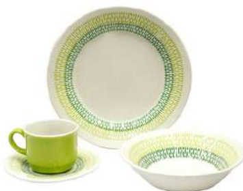
Vajilla CORONA Jaspe Verde 4 Puestos/16 Piezas