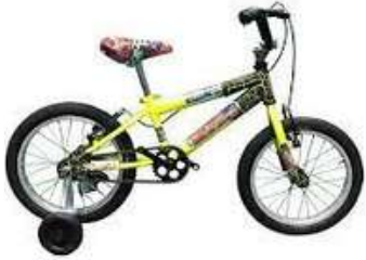
BICICLETA RIN 16 ACERO MOTIVO CARS/SPIDERMAN