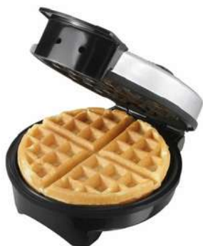
Waflera OSTER 4P CKSTWF2000"PI

Contado: $ 100.000 Cuota Inicial: $ 25.000 3 Semanas: $ 32.000