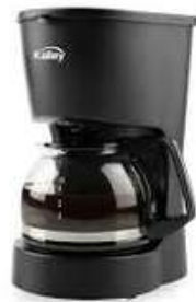
Cafetera KALLEY K-MCM4N 4 Tazas

Contado: $ 186.000 Cuota Inicial: $ 75.000 6 Semanas: $ 25.000