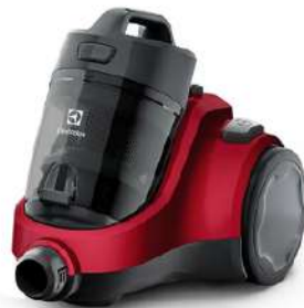
Hidrolavad 1600PSI 1700W Elite

Cuota Inicial: $ 110.000 16 Semanas: $ 38.000