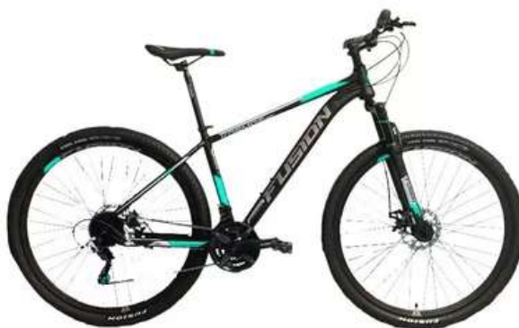
BICICLETA FUSION KOSMOS RIN 29 MARCO EN ACERO SUSPENSION CON BLOQUEO