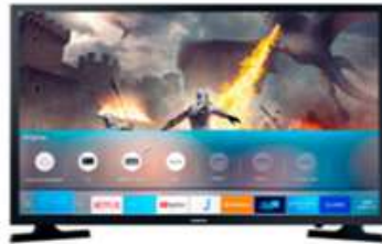
TV LED Smart Samsung 32\" (80 cm) HD UN32T4300 Negro Contado: $ 1.100.000 Cuota Inicial: $ 290.000 19 Semanas: $ 55.000