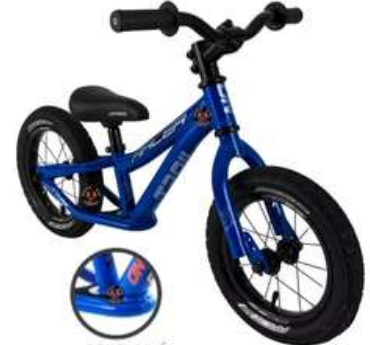
BICICLETA RIN 12 IMPULSO IMPOTADA

Cuota Inicial: $ 50.000 7 Semanas: $ 30.000