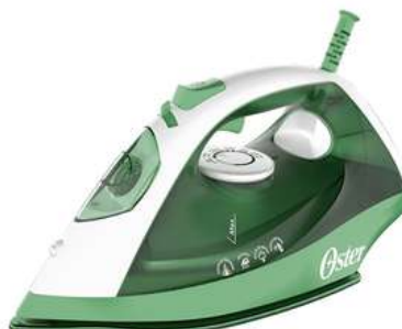
Plancha de Ropa OSTER suela antiadherente 2115014 Verde Menta

Contado: $ 93.000 Cuota Inicial: $ 25.000 4 Semanas: $ 20.000