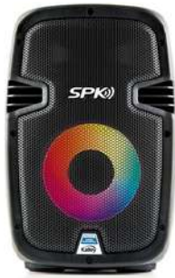
Parlante KALLEY K-SPK5OBL2 Negro

Contado: $ 365.000 Cuota Inicial: $ 100.000 10 Semanas: $ 35.000