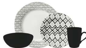
Vajilla Corona Dinka 4/16Pz