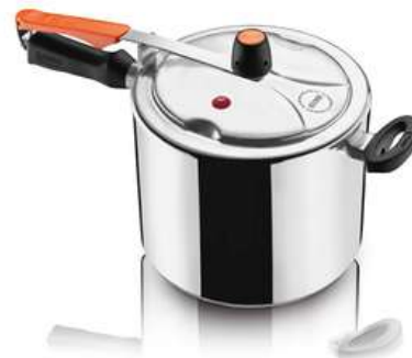
Olla a Presión IMUSA 7 Litros SecuryPlus Cierre Interno

Contado: $ 340.000 Cuota Inicial: $ 60.000 14 Semanas: $ 25.000