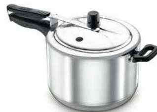
Olla A Presión IMUSA Maxi 6 Litros en Aluminio